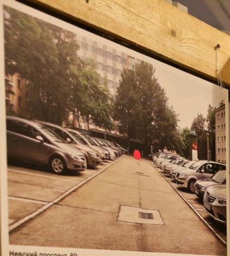
Невский проспект, 89

Создан в 18-м веке, классический, 5-2 этажа в 1940-1950 годах построены многоквартирные дома в стиле сталинского классицизма Надстройка 2004 На территории в 2009 году открылся парк на Невском в этом месте